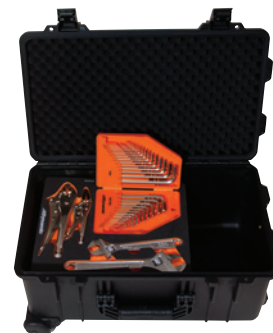
Avec des plateaux en mousse

Pour trouver le détaillant Dynamic le plus près de chez vous, visitez le site www.dynamictools.ca/fr/wheretobuy