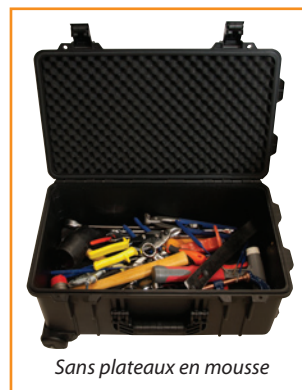
Sans plateaux en mousse