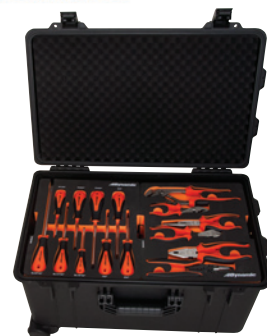
Avec des plateaux en mousse