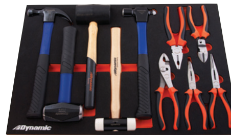
21 7/8 po (large) X 15 po (prof.) X 1 1/4 po (haut)