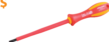
Tournevis à fente - poignée isolée

Taille d'extrémité: Prix courant : D062701 1/8 po 11,81 $ 7,99 $