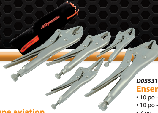
D055316 Ensemble de 5 pinces-étaux • 10 po – mâchoires droites • 10 po – mâchoires courbées • 7 po – mâchoires courbées avec coupe-fils • 6 po – à bec long • 5 po – mâchoires courbées avec coupe-fils Prix courant : 105,07 $