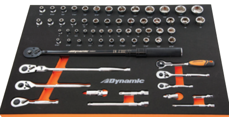
21 7/8 po (large) X 15 po (prof.) X 1 1/4 po (haut)