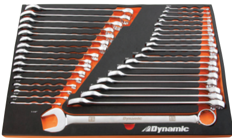
21 7/8 po (large) X 15 po (prof.) X 1 1/4 po (haut)