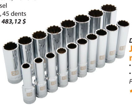
D018007 Jeu de douilles profondes métriques, 18 pièces 142,99 $ • 12 pans • 10 à 27 mm Prix courant : 216,62 $