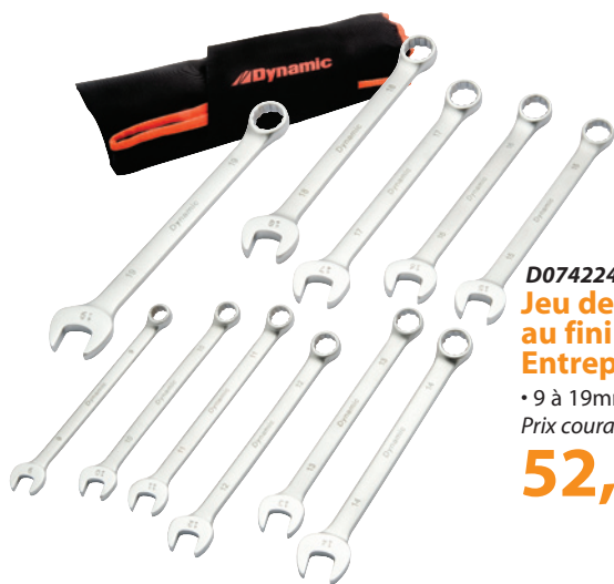
D074224 Jeu de 11 clés mixtes métriques au fini satiné - série Entrepreneur

• 1/4 à 15/16 po Prix courant : 99,85 $ 65,99 $