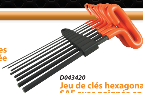
D043420 Jeu de clés hexagonales SAE avec poignée en boucle, 8 pièces

• 2 à 10 mm Prix courant : 46,34 $ 30,99 $