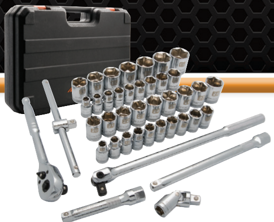
D018010 Jeu de douilles standards SAE/métriques, 41 pièces 317,99 $