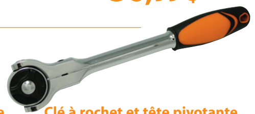
Clé à rochet et tête pivotante - 72 dents, prise confortable

Prise courant : 37,99 $ D001302 1/4 po 56,89 $