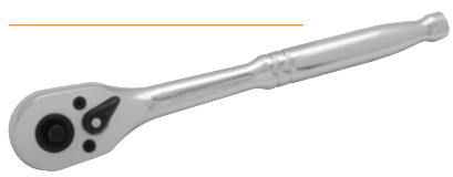
Clé à rochet à dégagement rapide - poignée chromée

Prise courant : 26,99 $ D001301 1/4 po 39,84 $