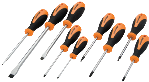
D062500 Jeu de 9 tournevis – prise confortable 52,99 $