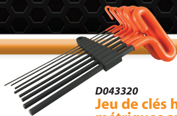
D043320 Jeu de clés hexagonales métriques avec poignée en boucle, 8 pièces

• 2 à 10 mm Prix courant : 46,34 $ 30,99 $