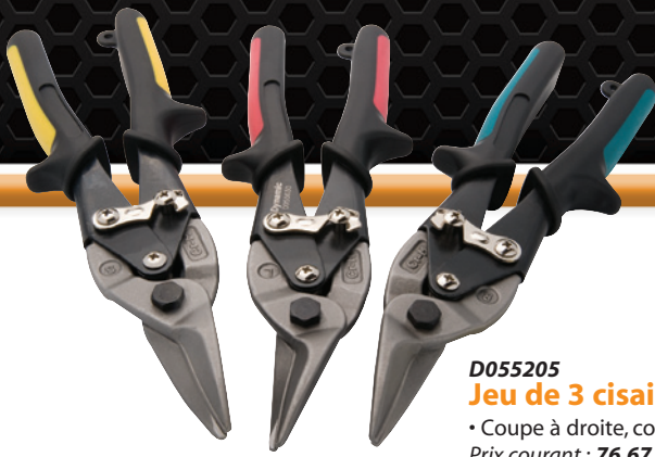
D055205 Jeu de 3 cisailles type aviation • Coupe à droite, coupe droite, coupe à gauche Prix courant : 76,67 $