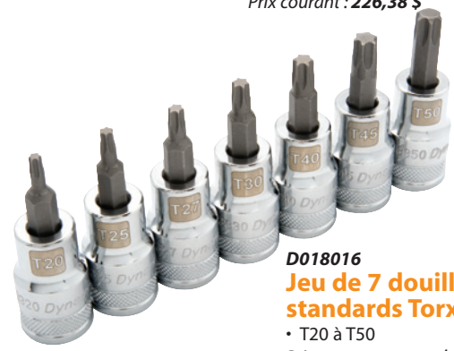
D018016 Jeu de 7 douilles standards Torx® 36,99 $ • T20 à T50 Prix courant : 55,77 $