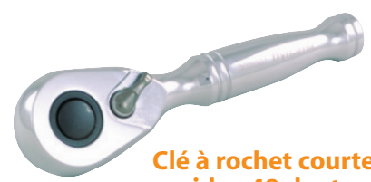
Clé à rochet courte et dégagement rapide - 48 dents, poignée chrome

• Une clé à rochet qui offre une excellente polyvalence.