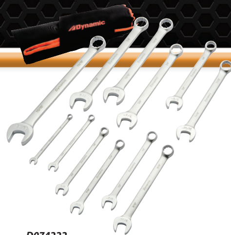
D074222 Jeu de 12 clés mixtes SAE au fini satiné - série Entrepreneur

• 5/64 à 3/8 po Prix courant : 46,34 $ 30,99 $