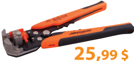
D095002 Pince à dénuder les fils autoréglable • Dénude rapidement les fils de jauge américaine des fils 10 à 24 • Outil à sertir et couper sur la poignée même Prix courant : 38,26 $