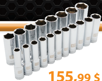
D018005 Jeu de douilles profondes métriques, 19 pièces 155,99 $ • 6 pans • 10 à 28 mm Prix courant : 237,06 $