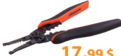
D095001 Pince à dénuder/couper - poignée confortable • Dénude un fil massif de 8 à 20 AWG et un fil multibrin de jauge américaine des fils 10 à 22 • Mâchoires dentelées pour tirer, courber et boucler les fils Prix courant : 26,73 $