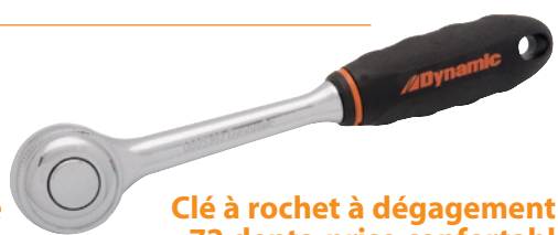
Clé à rochet à dégagement rapide - 72 dents, prise confortable

Prise courant : 26,99 $ D001301 1/4 po 39,84 $