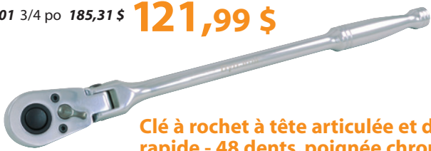
Clé à rochet à tête articulée et dégagement rapide - 48 dents, poignée chrome

Prise courant : 41,99 $ D005308 3/8 po 62,95 $