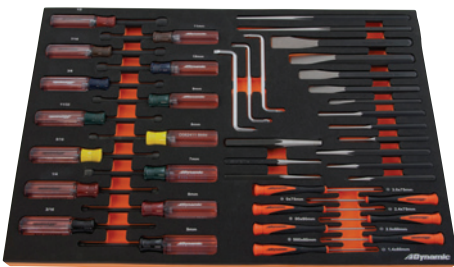
21 7/8 po (large) X 15 po (prof.) X 1 1/4 po (haut)