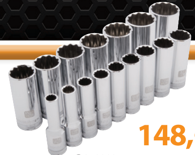
D018003 Jeu de douilles SAE, profondes, 16 pièces 148,99 $ • 12 pans • 3/8 à 1 5/16 po Prix courant : 226,38 $