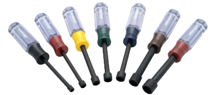
D062504 Jeu de 7 tourne-écrous métriques, poignée en acétate • 5 à 11 mm Prix courant : 75,73 $ 49,99 $