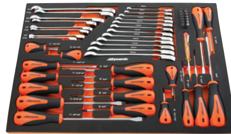
21 7/8 po (large) X 15 po (prof.) X 1 1/4 po (haut)