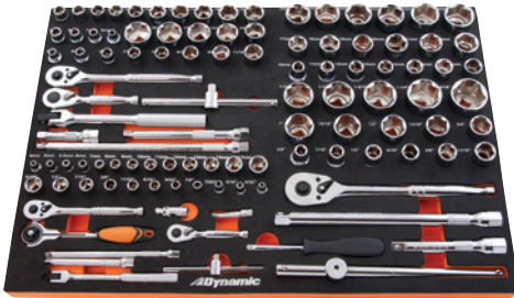
21 7/8 po (large) X 15 po (prof.) X 1 1/4 po (haut)