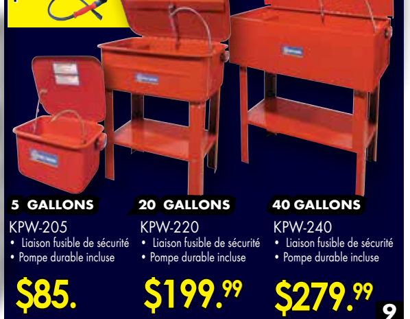
5 GALLONS KPW-205 • Liaison fusible de sécurité • Pompe durable incluse $85.

BROSSE DE NETTOYAGE POUR BASSINS DE NETTOYAGE KM-059 $19.99