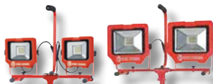
KC-3002LED-ST Lampe de travail DEL 15W émettent 6000 lumens