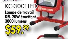
KC-3001LED Lampe de travail DEL 20W émettent 3000 lumens