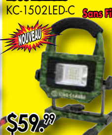
Lampe de travail DEL 10W émettent 1500 Lumens KC-1502LED-C Sans Fil

COMPREND BASE MAGNÉTIQUE ET 4 BATTERIES AA PANASONIC