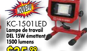
KC-1501LED Lampe de travail DEL 15W émettent 1500 lumens