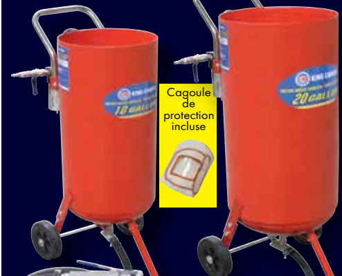
10 GALLONS KSB-10