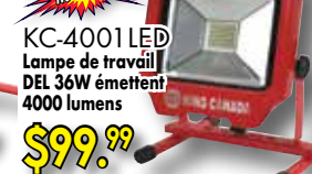
KC-4001LED Lampe de travail DEL 36W émettent 4000 lumens