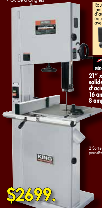
2 Sorties de poussière 4"

21" x 21" Table solide en fonte d'acier 16 amp. @ 110V 8 amp. @ 220V