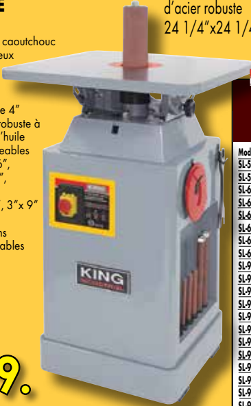
Table inclinable en fonte d'acier robuste 24 1/4" x 24 1/4"