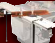
TABLE COULISSANTE INDUSTRIELLE KST-101