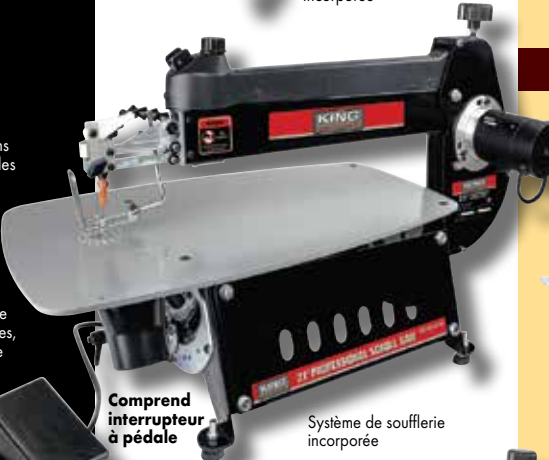
Comprend interrupteur à pédale