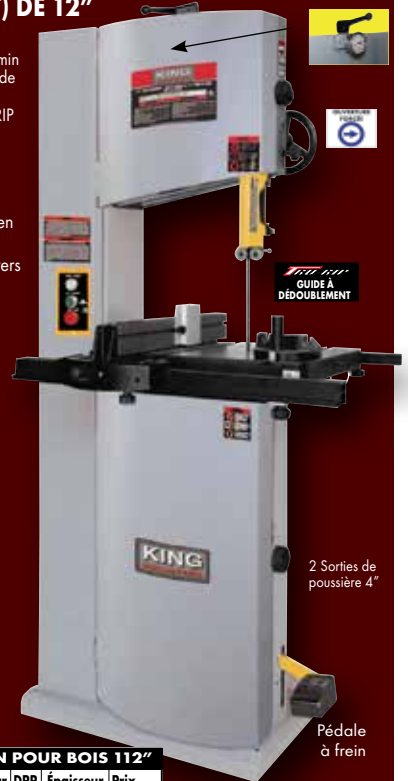
Jauge hydraulique pour la tension de la lame

20" x 16" Table solide en fonte d'acier inclinable de 5° vers la gauche et 45° vers la droite