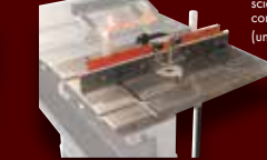
TABLE À TOUPIE ET GUIDE INDUSTRIELLE KRT-100