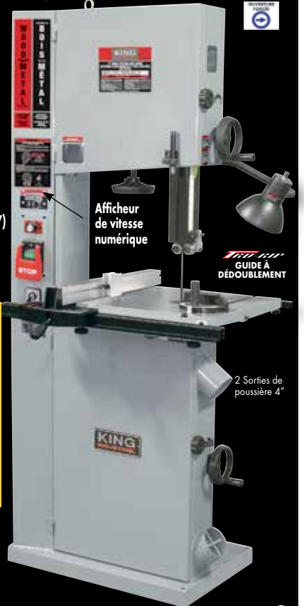
GUIDE À DÉDOUBLEMENT