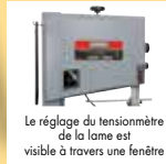
Le réglage du tensionnètre de la lame est visible à travers une fenêtre