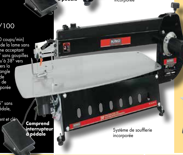
Comprend interrupteur à pédale