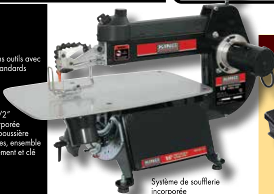
Système de soufflerie incorporée